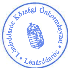
Vincze Orsolya Ügyrendi Bizottság Tagja